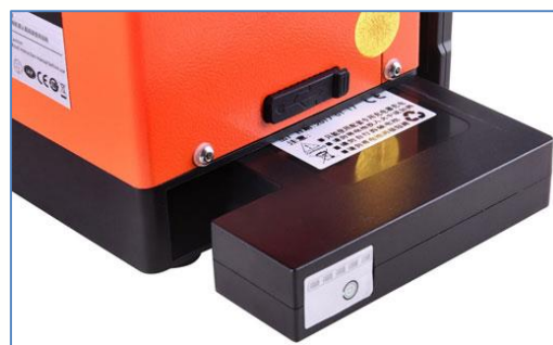
Емкость батареи -5200мАч