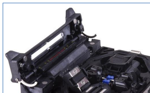
Время усадки -15 с